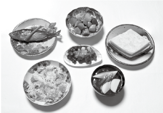
昭和初期に出されたひな節句の膳（サンプル）

食材や調理品があふれる今日、伝統的なふるさとの味が失われつつあります。今回、昭和初期に食べられた筑紫野市の四季の日常食と行事食の食品サンプルを展示し、当時の人々の「おいしい！」をその生活の背景とともに紹介します。