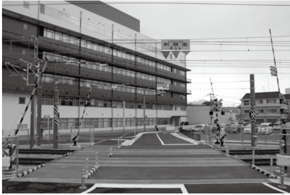
市役所南側の JR 線踏切

これにより、自動車での来庁が複数方面から可能となり、災害時の防災拠点としての機能が向上しました。