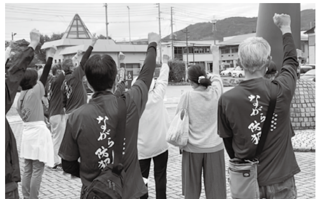
揃いのTシャツを着て出発する皆さん

昨年の11月から始めた募集では80人以上の賛同があり、出発式となったこの日は「ながら防犯」の文字の入ったTシャツを着た多くの皆さんが集まり、それぞれウォーキングしながら散会していきました。