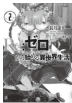
Re:ゼロから始める異世界生活

※英語の cheat(いかさま)から転じて「ずるいほど強い」という意味の若者言葉