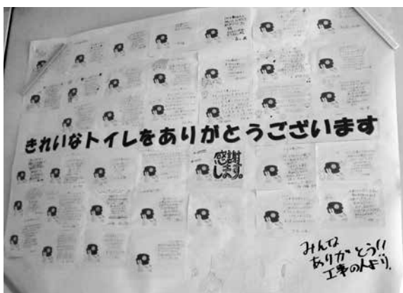
生徒から工事関係者への感謝の手紙が学校に掲示されました(写真は筑山中学校)

市では、子どもたちが学業に専念でき、充実した学校生活を送れる環境を整えるため、小中学校の改修工事などを行っています。空調設備やプールなどの改修に加えて、今年は小学校2校（筑紫小、筑紫東小）、中学校2校（筑山中、筑紫野南中）のトイレ改修工事を進めています。