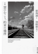
小説 雲のむこう、約束の場所