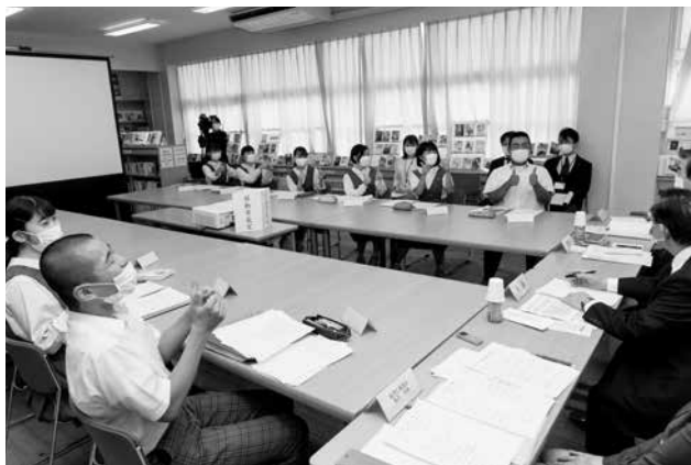
藤田市長にみんなで「グッジョブ！」