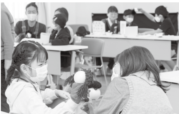
人形劇を通じたコミュニケーションでみんな笑顔に

発泡スチロールの玉を使った顔に、毛糸で好きな髪型を作り人形を作成。劇団員から「ユーモアと意外性が大事」などのアドバイスを受けて親子で即興の人形劇にチャレンジしました。相手の動きを見ながら呼吸を合わせ、親子で人形劇を楽しみました。