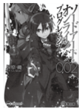
ソードアート・オンライン プログレッシブ