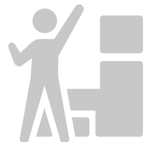
将来人口・世帯数の推計