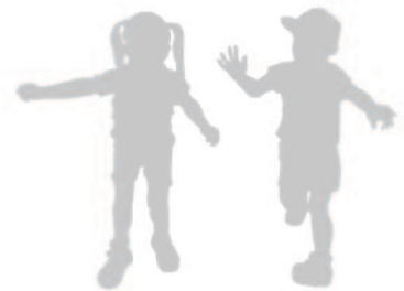
子ども・子育てビジョンの策定