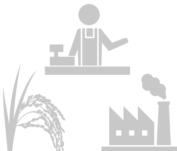
産業振興・雇用対策施策