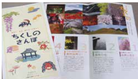
観光マップ「ちくしのさんぽ」

市長 外国人観光客の人数については、正確に把握することは困難であるが、昨年度、観光案内所における外国人からの相談が約500件あり、市内に免税店もあることから、一定の観光客がおられるものと考えている。 また、外国人向けガイドブックについては、観光マップ「ちくしのさんぽ」の英語版を作成している。