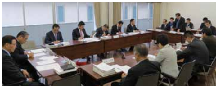
委員会での総括質疑の様子