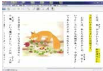
マルチデザイン教科書 (パソコン・タブレット使用可)

ある。結果、読む事 への抵抗等が減り、 読める字が増え、理 解力が向上したとの 声が多数あった。 特別支援学級・通 級指導教室の児童 生徒の状況に応じ 、デジタル教科書 は必要ではないか。 また支援教材を必 要とする児童生徒 数と、その教材は 揃っているのか。