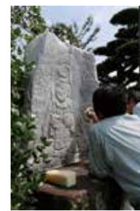
【山家宿の恵比須石像(市有形文化財)】

筑紫野市と太宰府市にまたがる山で、鳥海山、富士山に次いで霊山として日本で3番目に史跡指定されました。