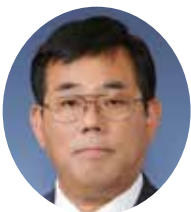
宮崎 吉弘 (公明党)

議員 福岡県において平成29年に発生した「特殊詐欺」の被害額は約11億4263万円、前年比72%増で、目指す撲滅には至っていない。また還付金詐欺の被害件数も増加しており注意を必要としている。被害件数とその内容はどのようになっているか。