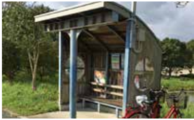
屋根があるバス停

交通事業者等と連携した一体的な交通網の形成を目指している。バス停のベンチや上屋の設置は、交通施策を推進する中で、必要なものについては検討していきたい。