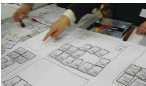
HUGによる机上訓練中

市長 地域での避難所運営ゲームの実施については、小学校区で取組みを始められている。防災士の育成は、福岡県が主催する防災リーダー研修の受講を推奨しており、女性も受講されている。