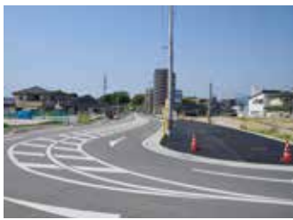
土地区画整理事業

市長 土塁の影響により事業計画及び換地計画の変更を余儀なくされることから、現在、県の指導、助言をいただき検討を進めている。引き続き、県と密に連携を図り、筑紫地区まちづくりの整備事業も含め、一日も早い事業完了を目指す。