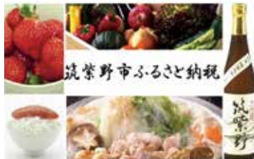
筑紫野市ふるさと納税