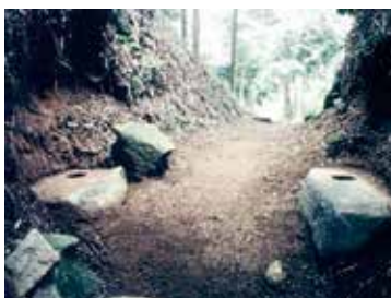
【基肄(椽)城跡(国特別史跡)】