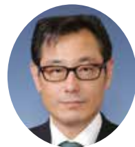
古賀 新悟 (日本共産党)