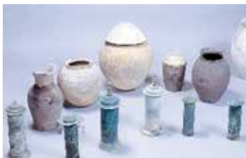
【武蔵寺経塚群出土品(市有形文化財)】

市内に所在する、国の法律、県及び市の条例で指定・登録された史跡等の文化財は、39件あります。今回は、その内、5箇所を紹介いたします。