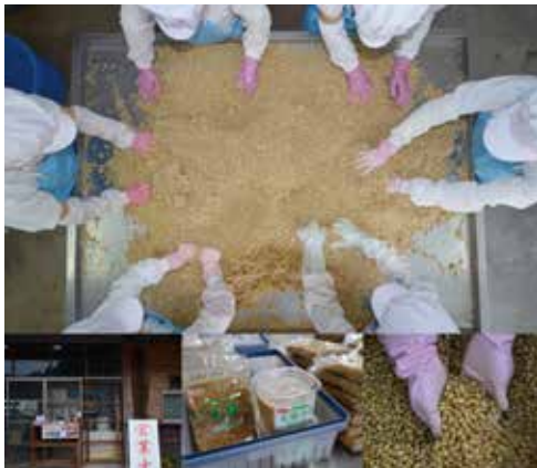
農事組合法人 山口農産 「天拌みそ」