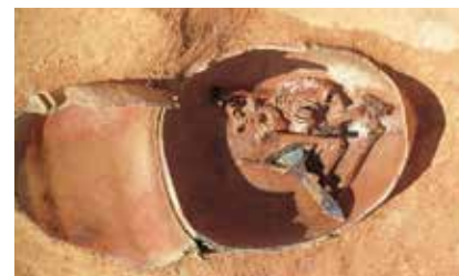
【隈・西小田遺跡群出土品(国重要文化財)】