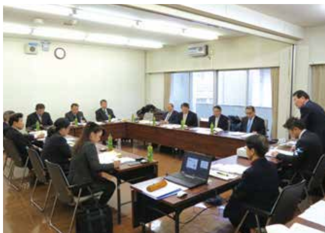
2時間の活発な意見交換に