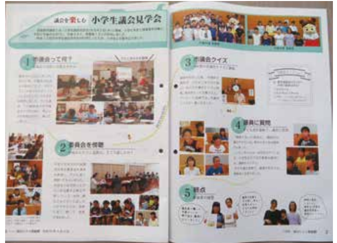
議会からの報告。資料は議会だよりを使用