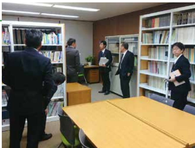
活動に必要な蔵書の整理、充実をはかった大津市の議会図書室

政策立案や研究のために、書籍を揃えることや、議会の持つ情報を、利用、提供する場として図書室整備って、大事なな。