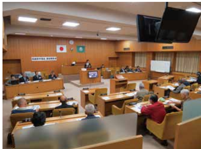
議場での開催は初。参加者は議員席に