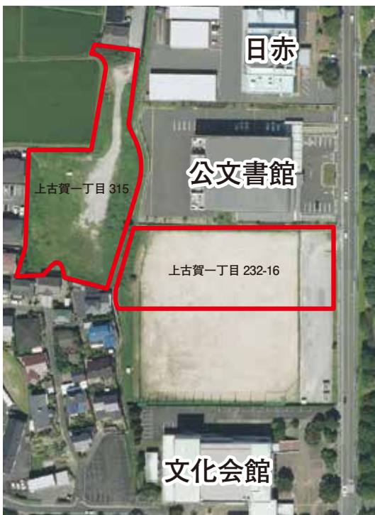
県から購入する上古賀グラウンドの位置図 ※グラウンドの一部は、市の土地

執行部 年間で約1万2千人の利用者があります。主に軟式少年野球やグラウンドゴルフの練習及び大会等に利用している。