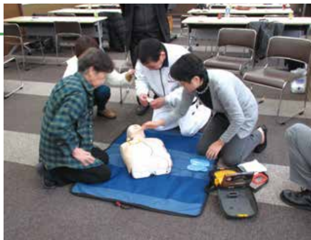
AEDの使い方を学ぶ議員