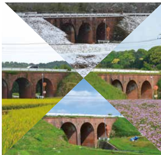
旧九州鉄道城山三連橋梁