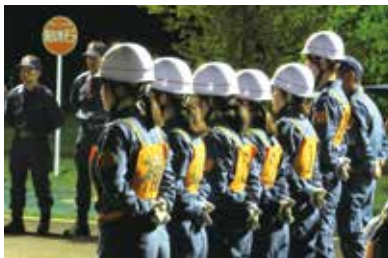
操法訓練に励む女性消防団員