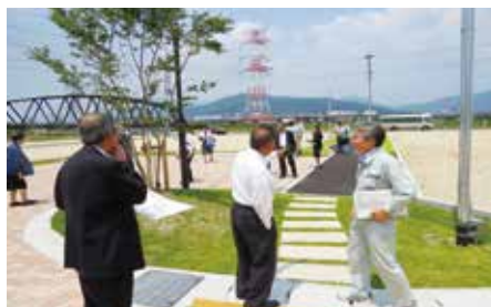
【筑紫、下見（市道路線、字の区域の変更確認）】

市道路線の認定及び字の区域の変更について執行部より説明を受け、現地にて確認を行いました。現場では委員から活発に質疑が行われました。また平成30年7月豪雨災害復旧箇所の現地確認を行いました。道路や河川などの公共土木施設災害は約9割、農地・農業施設災害等は約4割の