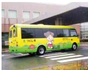
カミーリヤで接続するつくし号

市長 コミュニティバス、御笠自治会バスの運行により、地域公共交通網形成計画は大きく前進したと認識している。今後とも持続可能で安全安心な移動環境の構築に努めたい。