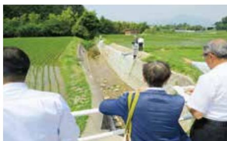
【萩原（河川災害復旧工事箇所）】