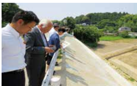
【城山（道路災害復旧工事箇所）】