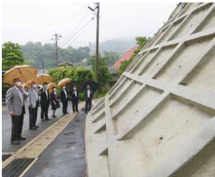
山口地区の工事完了現場