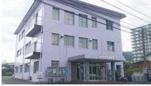
筑紫野市商工会館

持続化給付金等の申請での問題の一つはオンライン申請で、相談窓口等でのサポートをおこなったことで申請件数が増えてきている。