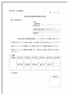
国民健康保険税 減免申請書