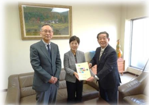
平成29年3月29日 審議会から市長へ答申を行いました。

筑紫野市では、「男女共同参画社会基本法」をはじめとする法令や、国・県の上位計画に基づき、新たに「 第3次ちくしの男女共同参画プラン 」（計画期間2018年～2027年）を策定しました。