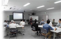
※「収納男子！セミナー」風景

今回の「収納男子！」も、男性がリラックスして楽しみながら、暮らしで活かせる内容を学べる講座となりました。また、性別役割分担意識にとらわれることなく、家庭の中で家事について分担していくことが大切だと実感させられました。(さて、次回はどんな企画が飛び出すか、乞うご期待！)