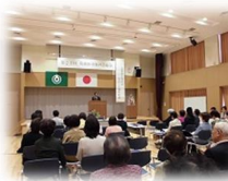
20周年記念事業風景

「筑紫野市翼の会」は、今年で団体の設立20周年を迎えることから、平成30年4月21日(土)に二日市東コミュニティーセンターにて、「筑紫野市翼の会設立20周年記念事業」を開催されました。