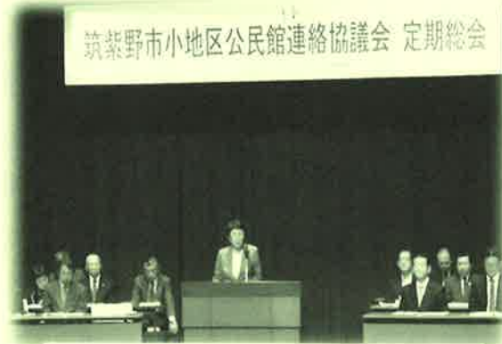
5月16日(土) 参加約170名 (さんあいホール)