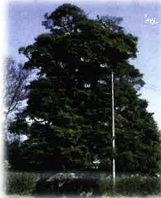
堂々とした風格の「タブノキ」

■川沿いの住宅街の細い道沿いにある「タブノキ」は、高さ16.4m、周囲4.6mと県内では最大級のもので、天然記念物として県指定されています。福岡県では、朝倉市の「古塔塚のナンジャモンジャ」とこの立明寺のものだけという大変珍しい大木です。