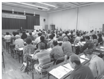
山家コミュニティ運営協議会総会

地域コミュニティ基本計画を策定するとともに、各コミュニティセンターに事務支援職員を配置します。