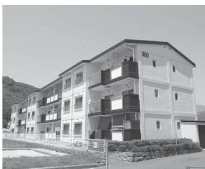
改修を行った市営小川住宅