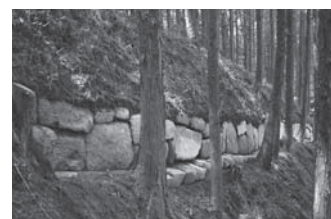
国指定史跡 阿志岐山城跡