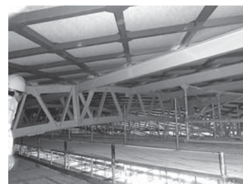
落下防止対策工事中の屋内運動場