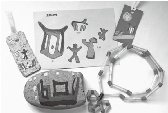
館内イベントで作ることができる作品の一例