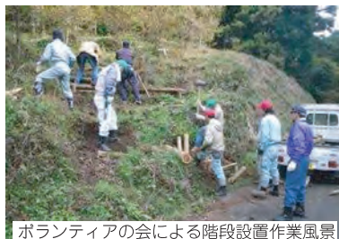
ボランティアの会による階段設置作業風景