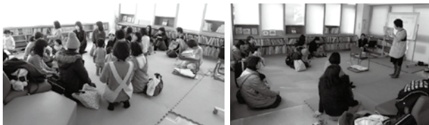
【「すこやか広場」のようす】