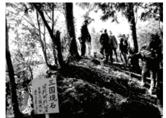
【これまでの長崎街道散策のようす】