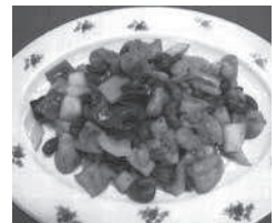
【メニュー例】 鶏とカシューナッツ炒め

□申し込み方法 ハガキまたは生涯学習課にて配布の申込書に、①講座名、②郵便番号、③住所、④氏名(ふりがな)、⑤年代、⑥電話番号を記入。 (定員を超えた場合は抽選にて決定)