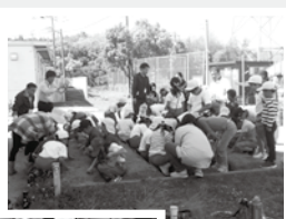
▶5月、種をまきました

子どもたちが、ひまわりの栽培を通して、協力することの大切さや命の大切さを身に付け、やさしい思いやりの心を育てていくことを目的として、平成14年度から、市内11の小中学校を順番に、毎年1校ずつ実施しています。