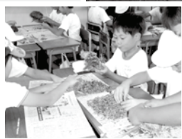
◀9月、種を採取しました