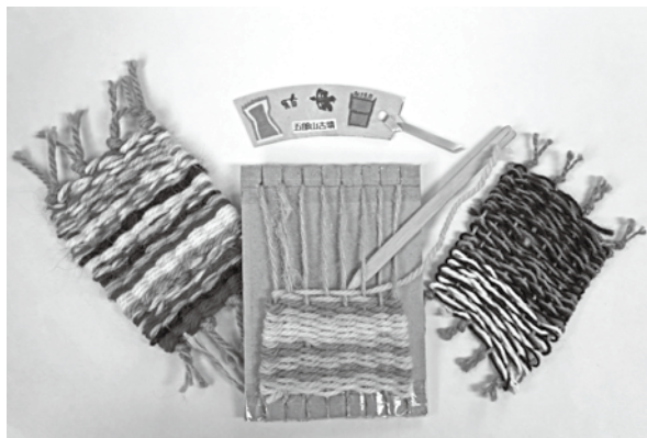
ダンボールを使ってコースターを織ります