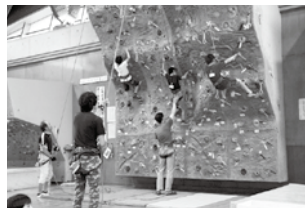
[初心者にゆっくりていねいに指導]