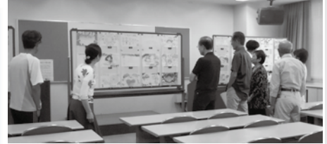
【実行委員会での審査のようす】