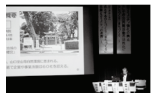
[昨年の推進大会のようす]