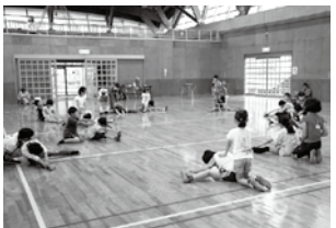
[けが予防のため柔軟体操も念入りに]