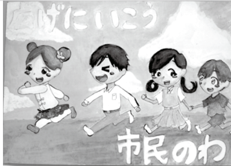
【中学生の部入賞作・ポスターに使用】 今村 有里さん (筑紫野南中学校 1 年生)