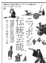
ニッポンの伝統芸能

人形劇を守り、育て、紡いでいくことの大切さを理解することで、未来の子どもたちに良いものを残していきたいませんか。