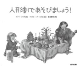
人形劇で あそびましょう!