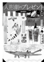
人形劇のプレゼント