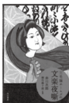
三毛猫ホームズの 文楽夜噺