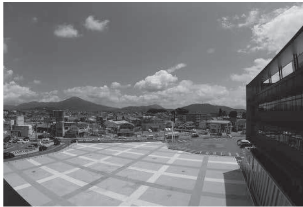
市役所ふれあい広場