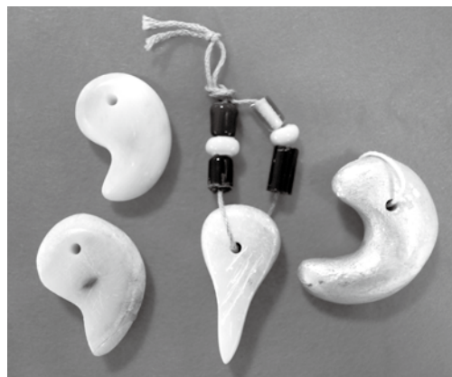
石こうを削って作る勾玉は力を使わずに作れます

実物と同じ材料ではありませんが、だれでも簡単に作ることができます。夏休みはぜひ博物館に来館ください。（申込不要）