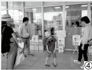
【昨年のように】① イベント広場をキャンパスに思いっきりお絵かき！ ②③ ペットボトルやバケツで絵を消しながら水まき ④ 環境課職員による環境学習

※今後の降水量によってはイベントを中止する場合があります。中止の場合はホームページなどで案内します。