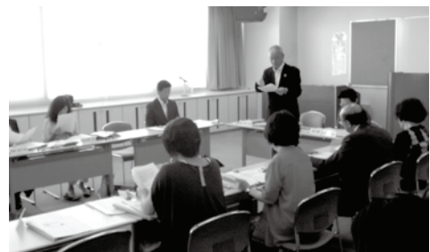
【社会教育委員の会 第1回会議のようす】