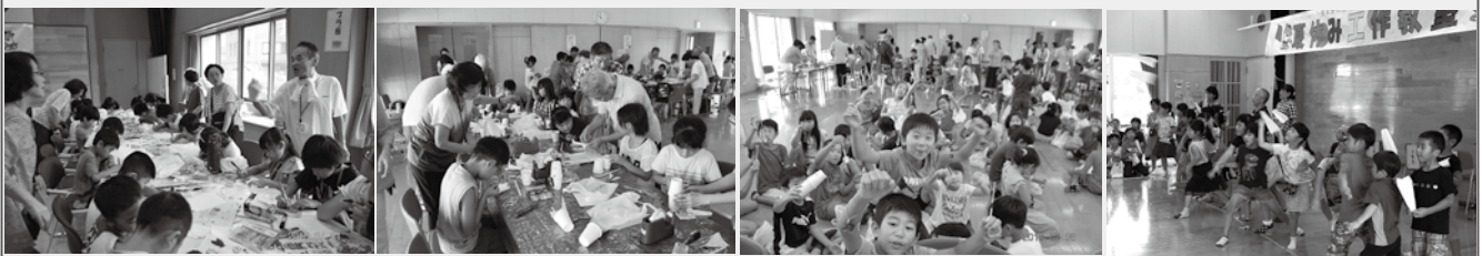
【写真は昨年的工作教室の様子。どの会場もたくさん子どもたちでにぎわいました】