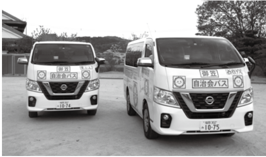
御笠自治会バス(こちらも年中無休で運行中!)

年中無休で運行中の「つくし号」、多くの皆さんのご乗車、ありがとうございます。 今回は、市マスネットキャラクタールのつくしちゃんが、つくし号と「御笠自治会バス」に乗って竜岩自然の家まで遊びに行ってきました。 御笠自治会バスは、高齢者などの交通弱者を支援するため、御笠まちづくり協議会と連携し、今年の一月から運行しています。この御笠自治会バスとつくし号は、カミリーヤや、ゆめタウン筑紫野で乗り換えができるダイヤになっており、つくしちゃんは「ゆめタウン」バス停でつくし号から御笠自治会バス