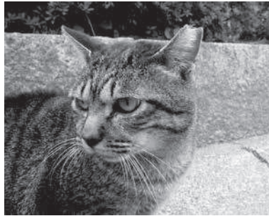
不妊・去勢手術をした猫は、耳をカットして「さくら猫」に

地域には、猫を好きな人、嫌いな人、アレルギーを抱える人など、さまざまの人が暮らしています。市では、誰もが快適に過ごすための方法として、飼い主のいない猫を適正に管理する活動、地域猫活動を行うことを推進しています。