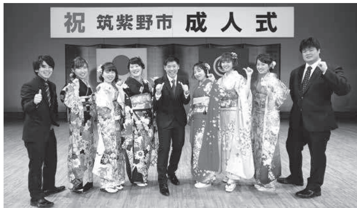
昨年の成人式実行委員の皆さん

課 生涯学習推進・青少年担当 ☎(918)3535 ▽電子メール k-gakushuu@city.chikushino.fukuoka.jp