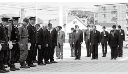
▲犠牲となられた方々に黙とうを捧げる参加者