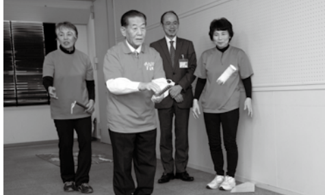
▲手作りの道具を使った「芯ロケット」