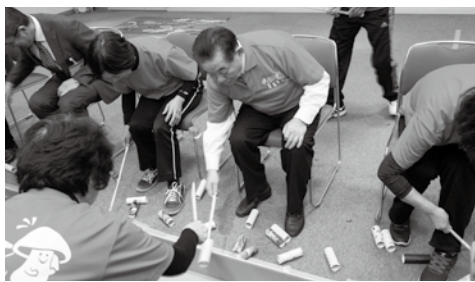
▲レクリエーション「かべの向こうへ」