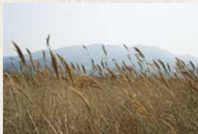
アシ原から見た宮地岳

城跡があります。「城（キ）」はこれを指していたのではないのでしょうか。この想像が正しければ「あしき」という地名はアシ原の背後にそびえ立つ山城に由来し、現代まで使われ続けていることになりました。文化財と私たちの住む地域や生活とは、大変深い関わりがあることがよく分かります。