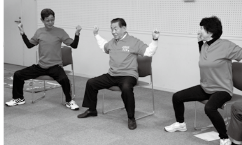
▲一緒に赤いシャツを着てトレーニング