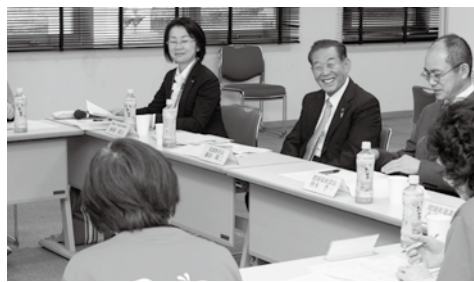
▲多くの意見を聞くことができました