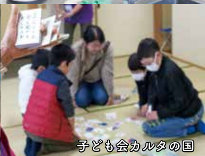
子ども会カルタの国