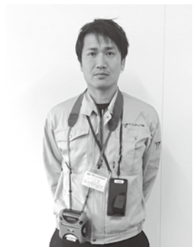
緑色の制服を着用しています

平成31年5月検針から、水道メーター検針業務の委託業者が九州マニテック株式会社になります。