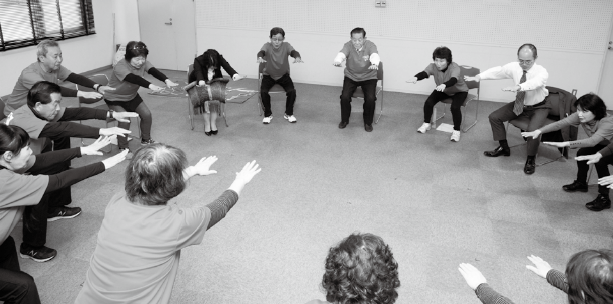
▲ロコモティブシンドローム（運動器症候群）予防の筋力トレーニングとしてのスクワット

健康 けんこう づくり運動サポーターの会 かい 筑紫野市民 しみん を元氣 げんき で笑顔 えがお にする運動サポーター活動 かつどう