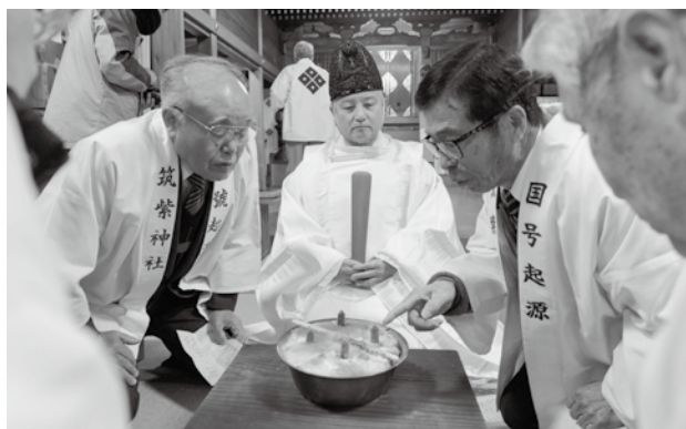
粥の中心を筑紫神社とし、東西南北に生えたカビで占います

市内原田の筑紫神社にて、市指定無形民俗文化財の「粥占祭」が行われました。この行事は、毎年2月15日に炊いた粥を銅鉢に盛り、箱に収めて、1カ月後の3月15日に取り出してカビの生え方で農作物などの吉兆を占うものです。銅鉢には文化2(1805)年と銘があり、200年以上続いていると考えられています。今年の粥にもびっしりとカビが生え、6人の判断委員により稲作「中」などから全般判断は「中」とされました。