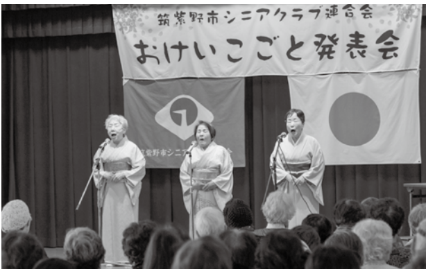
熱演・熱唱が続きました

約30の詩吟、カラオケ、踊りなど、日頃稽古を重ねた演目が次々と披露され、会場からは歓声や拍手喝采、楽しく和やかな雰囲気にもまれていました。