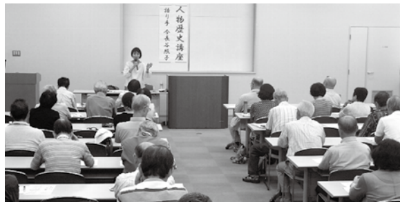
「人物歴史講座」学習風景