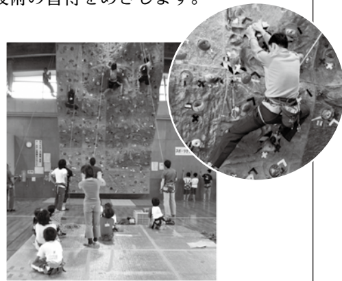
「スポーツクライミング教室」のようす