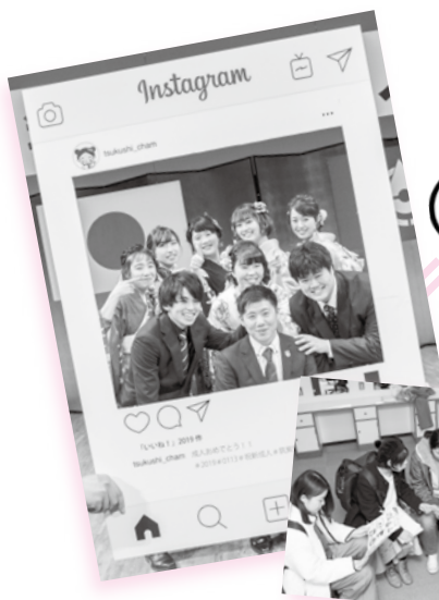
左)平成31年の実行委員の皆さん 右)記念アルバムの校正作業