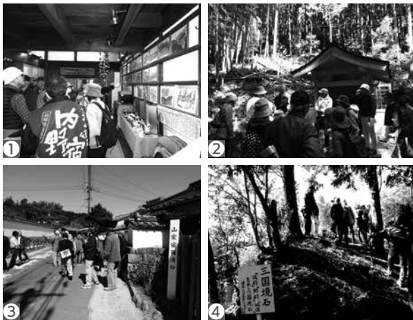
【昨年の長崎街道町並み散歩のようす】