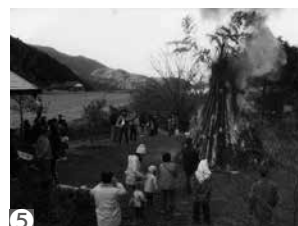
【竜岩自然の家主催講座のようす】