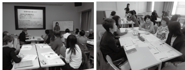
[日本語ボランティアスキルアップ講座風景]

☆次回「日本語ボランティアスキルアップ講座②」は3月19日(火)13時30分～16時30分に実施! 詳細は広報ちくしの2月15日号で案内します。