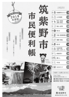
筑紫野市市民便利帳2018年度版

配布担当業者が1月上旬から下旬にかけて市内の全世帯に無料で配布します。2月上旬になっても手元に届いていない場合には、連絡してください。