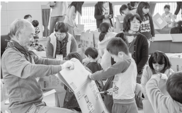
受講生は、子どもと触れ合いながらイベントを運営しました

受講生の皆さんは、子どもたちの「笑顔」をつくるため、講座で学んだことを家庭や地域で生かしていきます。