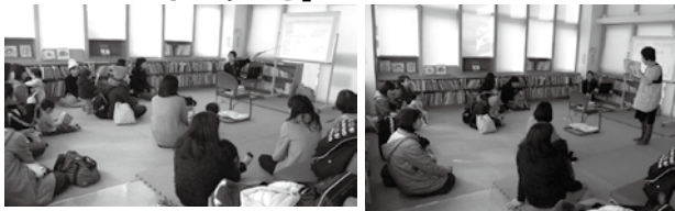
【昨年の「すこやか広場」のようす】