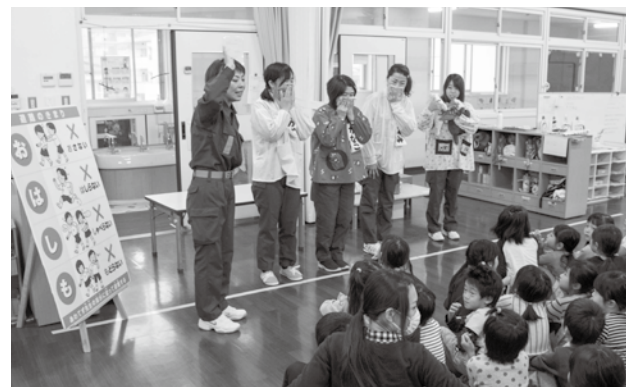
避難時の注意点では寸劇を披露し、園児たちは大盛り上がり

女性消防団が避難時の注意点について質問すると、園児たちはすぐに「こうするんだよ！」と話すなど、日ごろの避難訓練で学んだことを楽しく再確認していました。