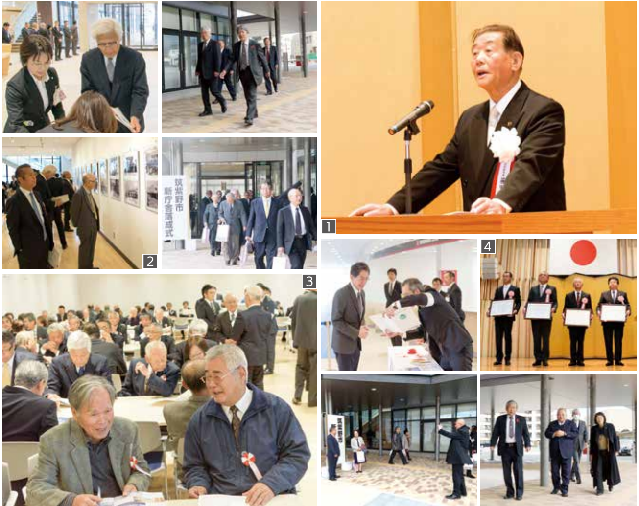
1 式辞を述べる藤田市長、2 展示情報コーナーに二日市町役場からの市庁舎の歴史や建築の経過を掲示、3 多目的ホールを控室として活用、4 建設設計・施工に当たった共同企業体の皆さんに感謝状を贈呈しました