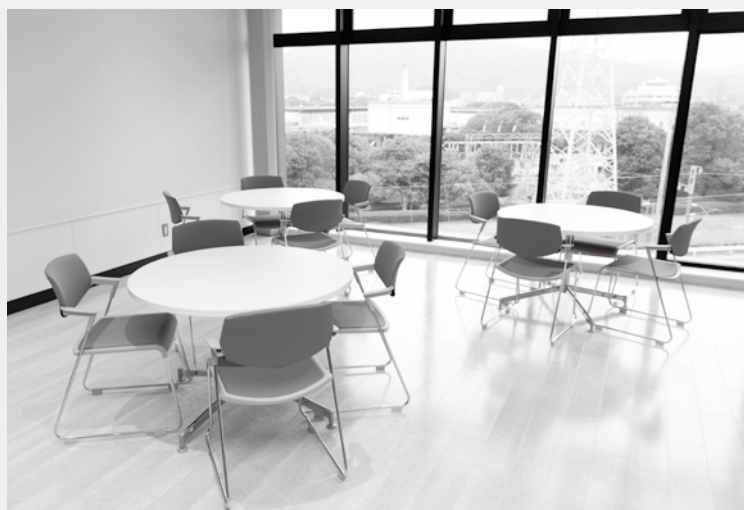
気軽に利用できるラウンジスペースを設置しています