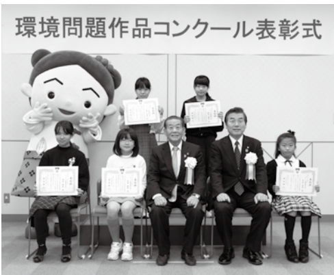
ちくしの環境夢大賞受賞者の皆さん