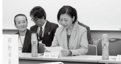
事例発表がありました