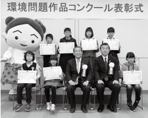
クリーンタウン賞受賞者の皆さん