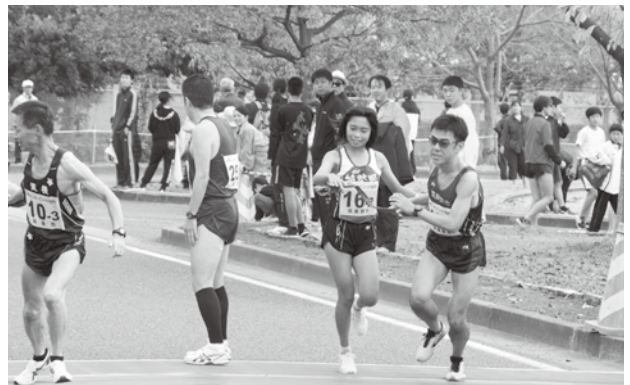
タスキをつなぐ筑紫野市チーム

この駅伝は、30.1キロを中学生からシニア(40歳以上)の精鋭9人で走るもので、学生から社会人へ、女性から男性へとタスキをつなぎました。沿道では応援団が声からして選手に楳(げき)を飛ばし、選手は任された区間を激走、次のランナーへタスキを懸命に届けました。