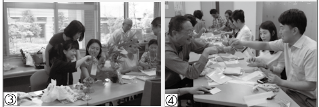
写真①②：少人数のグループにわかれての学習風景 ③④：日本文化紹介イベント(七夕)の様子