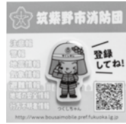
つくしちゃんピンバッジ

この義援金は、「防災メールまもるくん」の登録推進や消防団活動のサポートに活用されます。