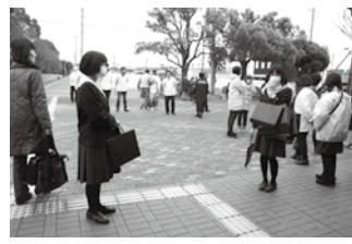
【昨年のボランティア活動のようす】