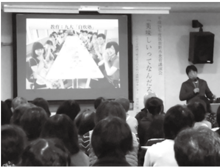
昨年の講演会の様子

子育て・孫育てをしている人や食に関心がある人にぜひ聞いていただきたい講演会です。