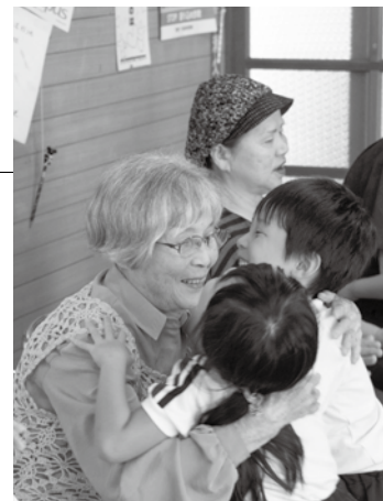
今号の表紙 街道保育所の4歳児クラスが、 朝倉街道団地の老人クラブ「街道 クラブ」を訪問し、交流をしまし た。(詳細は3ページ)