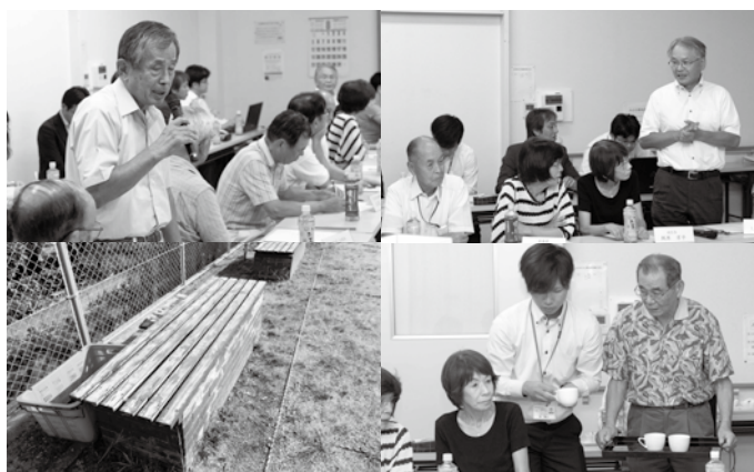
手作りの「防災かまどベンチ」 みかさ亭のデザートが振る舞われました

新しいサークル「男の料理遊び会」が8人でスタートしました。料理が不得手だった男性会員たちも1年もするころには上達し、奥様招待会を開催したところ、大好評。以降、恒例イベントとして年1回行い、3年もするころにはレシピさえあれば、ほとんどの料理ができるようになりました。