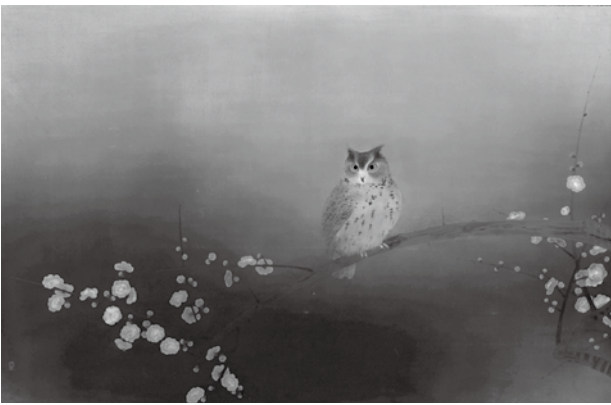
小林古径筆 <木菟図(みみずくず)> 昭和4年(1929年) 東京・大倉集古館蔵 11月6日～12月9日展示

本講座は解説講座です。特別展「オークラコレクション」は九州国立博物館にて10月2日(火)から12月9日(日)まで開催しています。