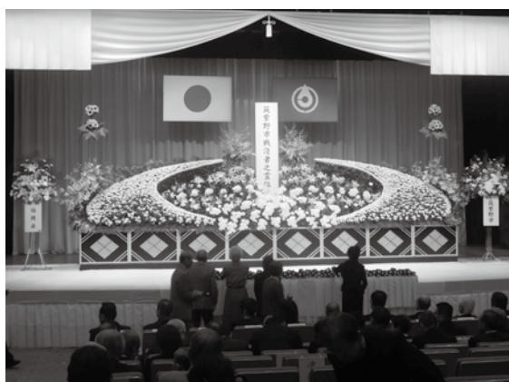
昨年の戦没者追悼式