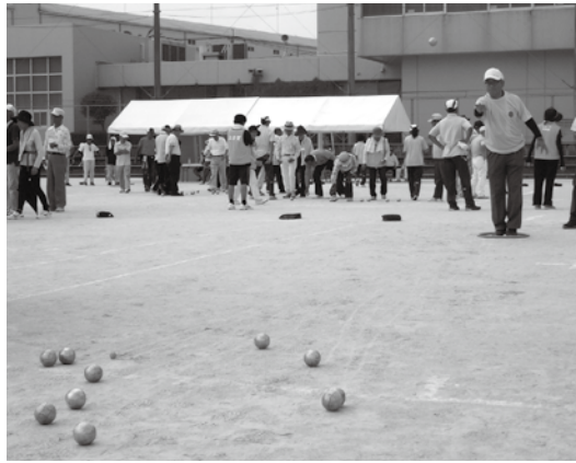
過去の大会の様子