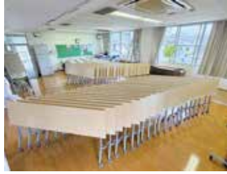
▲机36台、椅子108脚などを整備しました