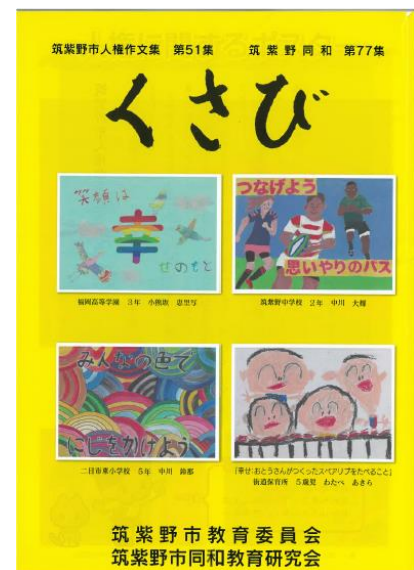
(啓発冊子・人権作文集)