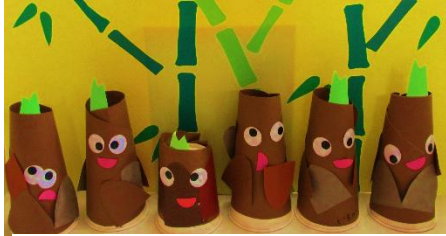
かわいたけのこが並びました。