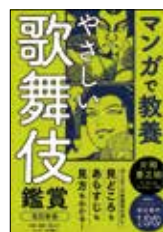
やさしい 歌舞伎鑑賞 清水 まり /企画・構成 (朝日新聞出版)