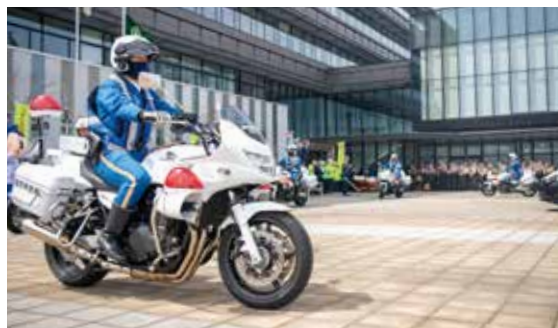
白バイを先頭に出発しました

春は入学、入園したばかりの子どもたちが慣れない通学を始めることもあり、交通事故の増加が懸念される時期です。4月6日(月)からの春の交通安全県民運動の一環として、市役所前ふれあい広場で出陣式が行われました。式の中では太宰府天満宮の巫女の2人が交通安全宣言をし、九州産業高等学校による和太鼓演奏に鼓舞された車両部隊が市内に向けて出発しました。