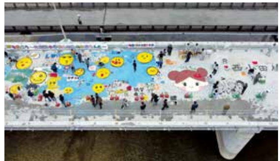
旧西小田橋は60年間、人や物を渡し続けました

今年の夏に開通予定の西小田にある西小田橋で、子どもたちが橋をキャンバスに絵を描きました。参加したのは卒業したばかりの筑紫東小学校の元6年生と地域住民などおよそ70人です。主催した県那珂県土整備事務所では「舗装後、絵は見えなくなりますが、橋の歴史となります。いい思い出にしてもらえれば」と話していました。