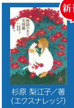
杉原 梨江子/著 (エクスナレッジ)

その花に花言葉があるのは知られていますが、古代から受け継がれてきた物語があるのはご存知でしょうか。この本では、誕生伝説のある花や象徴的な意味をもつ花などの物語が、美しいイラストと共に紹介されています。物語を知って、大切な人に花を贈るときや部屋に花を飾るときの参考にしてみてはいかがでしょうか。