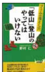
「低山」登山の やってはいけない 野村 仁/著 (青春出版社)