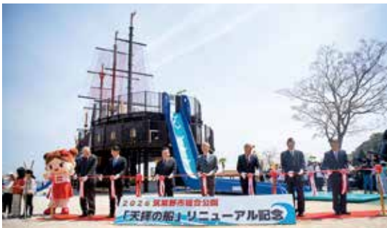
100組の参加者も平井市長と一緒にテープカットをしました

筑紫野市総合公園の大型遊具「天拝の船」のリニューアルが完了し、プレオープンイベントを開催しました。天拝の船には日本一の高さから滑るフリーフォールすべり台など魅力が満載で、船の周りにも海をイメージした遊具やインクルーシブ遊具などがたくさんあります。参加した子どもたちは歓声を上げながら、時間が足りないといばかりに遊び駆け回りました。