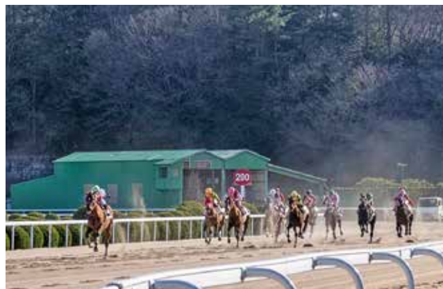
▲最後の直線、応援の声がはっきり聞こえる