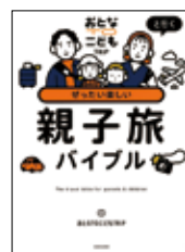
ぜったい楽しい 親子旅バイブル おとなTO こどもTRIP/著 (KADOKAWA)