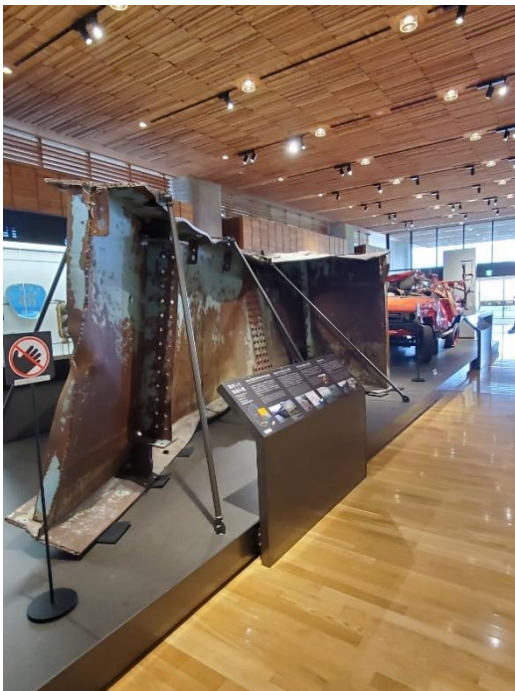
流失した気仙大橋 津 波の力で曲がった鉄筋