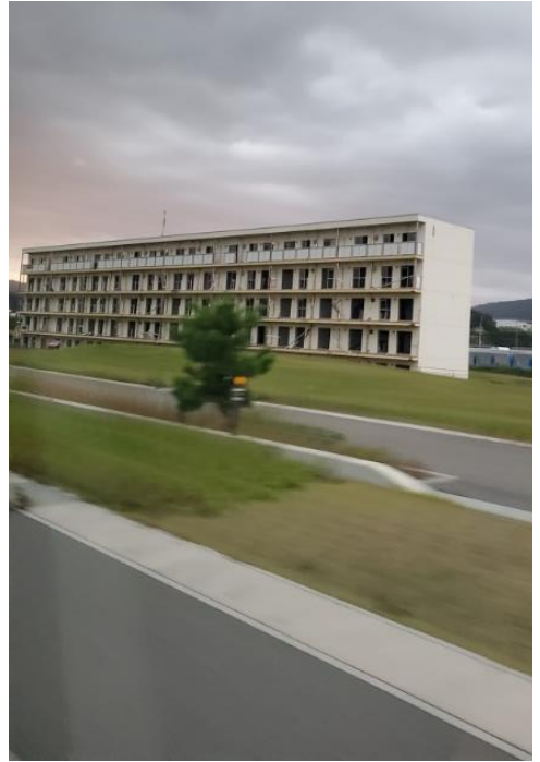
下宿定住促進住宅 4階までが完全に水没