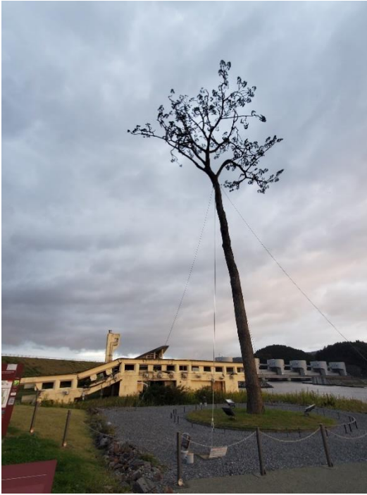
陸前高田ユーステル