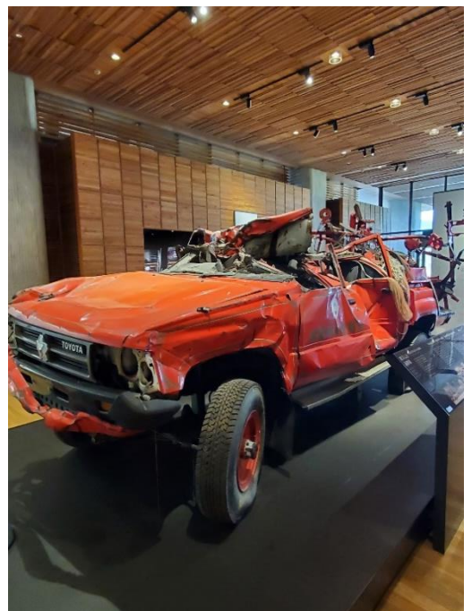
押し流された消防車