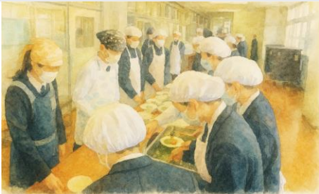
絆づくり週間 4月 (つながりづくり)

筑紫野南中学校では、4月に「絆づくり週間」を行っています。「絆づくり週間」とは、入学した1年生にとって覚えるのが大変な仕事を上級生が教え、中学校生活に早く溶け込めるようにと設定された取り組みのことで、給食の時間には、3年生が詳しい準備方法と給食委員の動きを教えています。最初はおぼつかなかった1年生たちも、上級生のアドバイスで、スムーズな配膳ができるクラスが増えました。このように、新入生を大切にする筑紫野南中の良い伝統が受け継がれています。