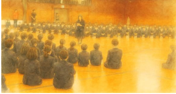
対面式 4月10日 (つながりづくり)