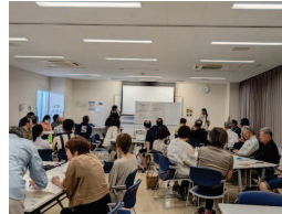
防災女子会「まもらんば」