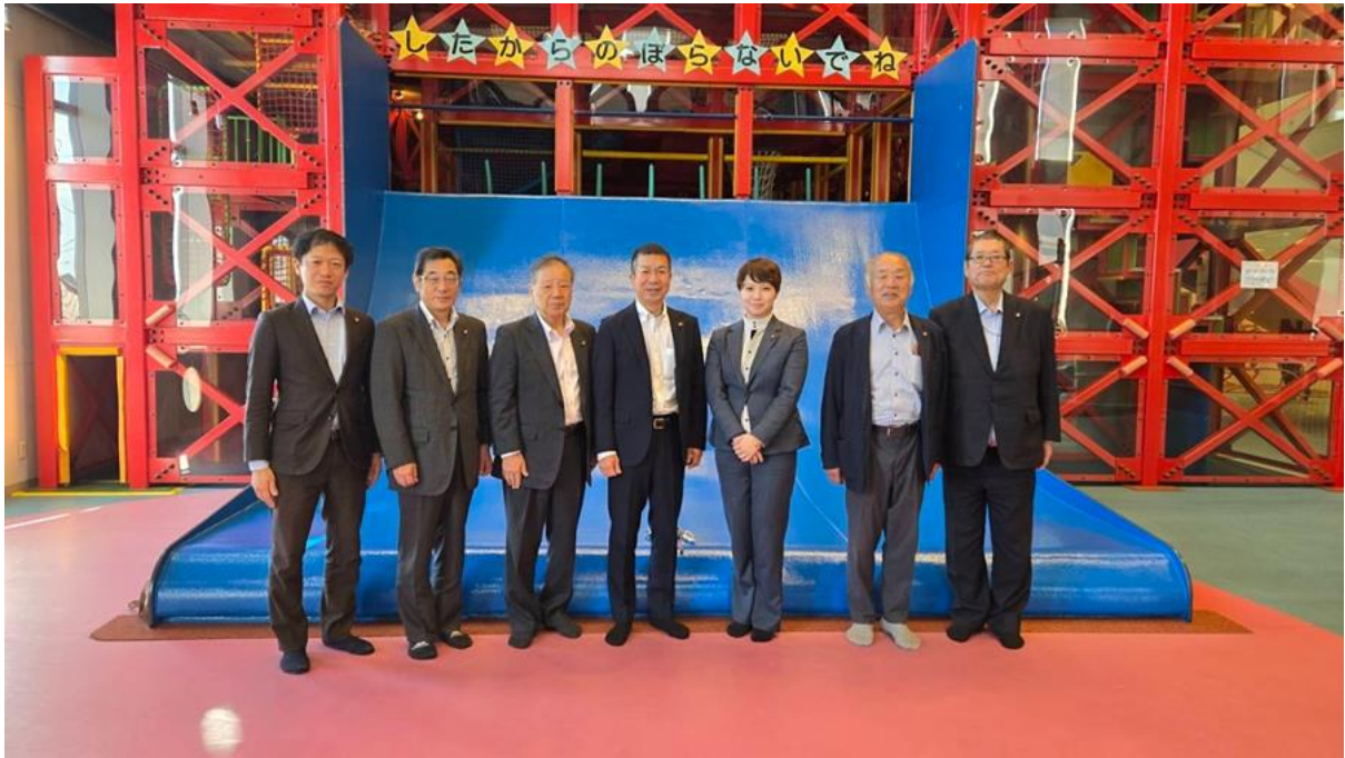
【視察研修状況写真】