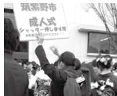
【中高生ボランティア活動のようす】