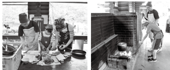
【前回(6月実施)の健康レシピのようす】