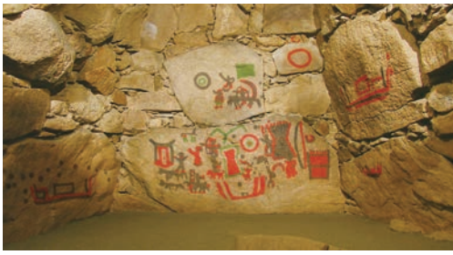
五郎山古墳奥壁の壁画

問 五郎山古墳及び可動式の実物大模型として、石室の装飾壁画を立ったま見ることが出来る日本唯一の施設である五郎山古墳館を、筑紫南エリアを巡る観光スポットとして、市内外に強くアピールすべきではないか。