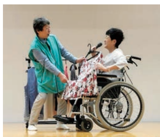
コミセン祭りの寸劇で買いもの支援紹介

答 本事業は、できるだけ多くのコミュニティ運営協議会及び自治会において、活動が始まり全的に広がっていくことが重要である。地域での取組は高齢者に限られるものではないが、まずは高齢者サロンの拡大や、日常の中での助け合いの発掘など、高齢者向けの活動から着手していただき、地域の状況に合わせた取組が広がっていくよう、支援していく。