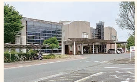
総合保健福祉センター「カミーリヤ」

答 今回整備する子育て支援拠点は、主に乳幼児の居場所と相談場所として位置づけているため、幅広い年齢層の子どもを対象とする子ども館とは異なるものである。