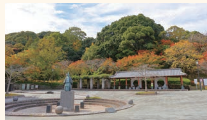
天拝山歴史自然公園

答 女性トイレの不足等を危惧する意見をいただいたため、ブース数の増加等は設計の中で十分配慮して検討を行っていく。また、登山客が増えているため、登山口側のトイレには道具を洗える水洗ブースを設ける等、使用者の利便性が上がるよう検討することとしている。