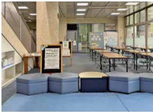
▲改修する生涯学習センター1階青少年プラザ