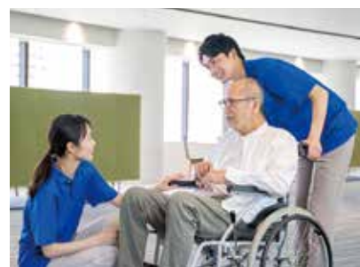
▲介護人材の確保を図ります

既存の支援に加え、住まいに関する課題を抱える生活困窮者などからの相談に対応するため、住まい相談支援員を配置し、住まいの安定確保に向けた支援を行います。また、ひきこもり状態にある人やその家族に対し、関係機関と連携して継続的な支援を行うため、ひきこもり相談支援員を配置し、社会参加などを支援します。