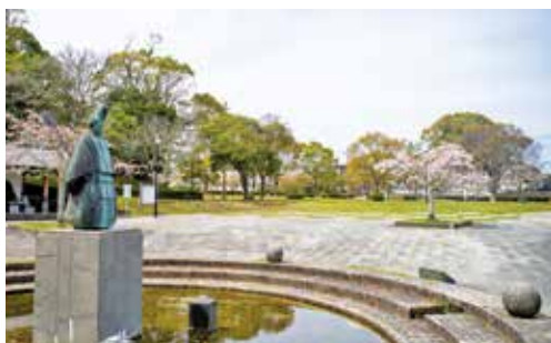
▲天拝公園のトイレを再整備します