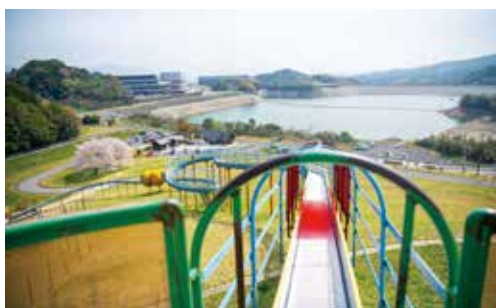
▲更新予定の総合公園の遊具