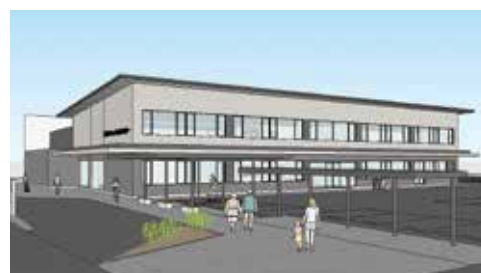
▲新しい二日市コミュニティセンター(完成予想)