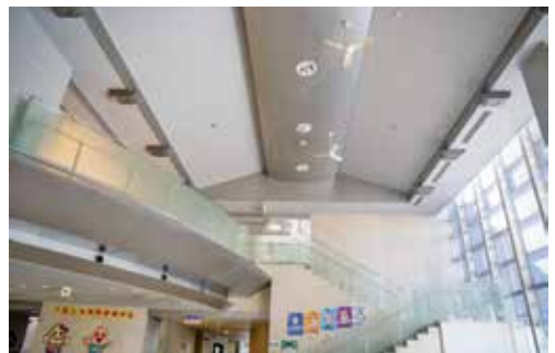
▲LED化予定のカミーリヤのエントランスホール

公共施設の省エネルギー化により、温室効果ガスの排出削減と、光熱費の抑制を図るため、小中学校やカミーリヤなどの照明設備のLED化を進めます。