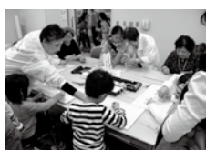
【昨年の活動のようす】