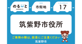
*乗降場所は路面シート・看板・バス停等のシールが目印

のるーとアプリ、LINE利用者限定 600円割引クーポンプレゼント!! クーポンプレゼントはお一人1回となります。