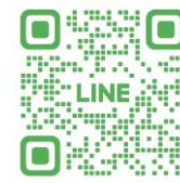
QRコードは株式会社デンソーウェーブの登録商標です