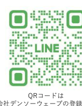
QRコードは株式会社デンソーウェブの登録商標です