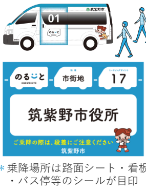
*乗降場所は路面シート・看板・バス停等のシールが目印