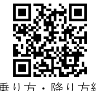
乗り方・降り方編